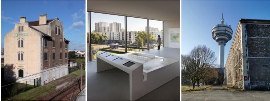
De gauche à droite : le Mémorial de l'ancienne gare de déportation de Bobigny, le Mémorial de la Shoah à Drancy et le Fort dit de Romainville aux Lilas

Pour ne jamais oublier et continuer à transmettre le Devoir de Mémoire, le département de la Seine-Saint-Denis a créé un comité de pilotage, dont Seine-Saint-Denis Tourisme fait partie intégrante, en proposant la mise en place d'actions en 2025 dans le cadre d'une mise en réseau des lieux de mémoire en Seine-Saint-Denis . Création d'un site internet dédié, organisation d'accueils presse, voyage mémorial pour des collégiens à Auschwitz ou encore candidature au label Patrimoine culturel européen en sont les grands temps forts.